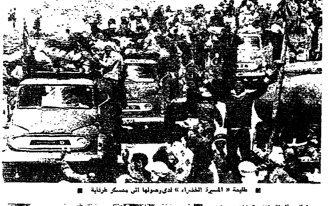
طلبة « المسرة الخضراء » لدى وصولها الى مسكر غرناية

علقت الهملة المغربية لخطوط المسكر الحديدية صباح امس من استئناف حركة القطارات المغربية التي كانت قد اوقفت منذ حوالي اسبوعين ، وان عملية استئناف حركة القطارات الخاصة بنقل البضائع ستبدأ ، اما قطارات الركاب فلها ستبدأ اليوم .